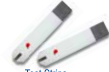
Test Strips Tira Reactivas